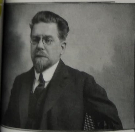
▲ Władysław Stanisław Reymont